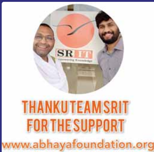
THANKU TEAM SRIT FOR THE SUPPORT