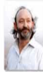
Sri Moncho Ferrer Rural Development Trust