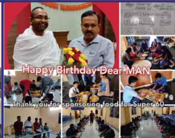
Happy Birthday- Dear MAN