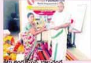
కుటుంబ శిక్షణ తరగతులు ప్రారంభం