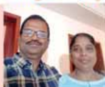
WE THANK FOR THEIR LOVE AND CARE FOR ABHAYANS!