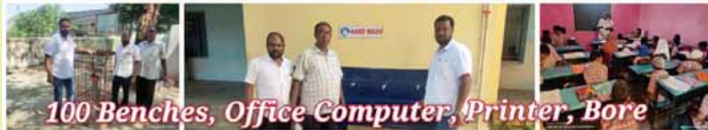
100 Benches, Office Computer, Printer, Bore well, TV, CC Cameras given to UPS, Kothapet