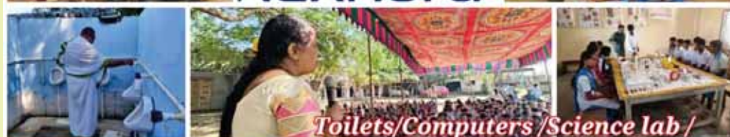
Toilets/Computers/Science lab / Plumbing work completed at ZPHS, Vilijerla