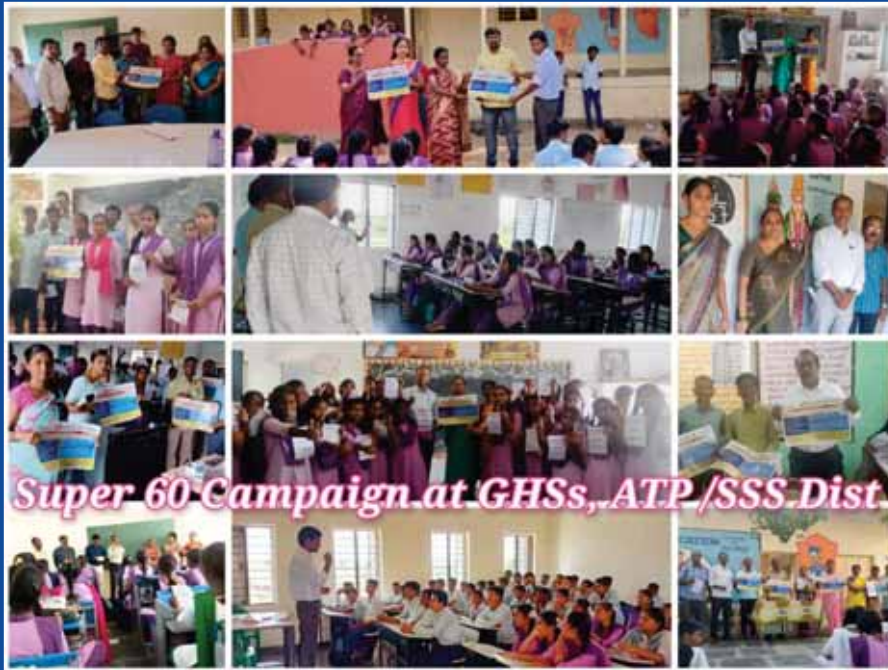
Super 60 Campaign at GHSs, ATP/SSS Dist